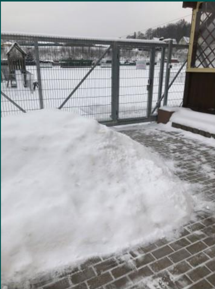
Nedůstojný přístup do šaten a zázemí sportoviště.

Jediná přístupová cesta k šatnám je bránou pro vjezd techniky, obcházením budovy restaurace. Mladí sportovci procházejí terasou restaurace, nezdávka mezi opilými hosty a v zakouřeném prostoru. V zimním období je složité nekrytou přístupovou cestu udržet v bezpečném stavu. Tající a namrzající sníh z budov je příčinou úrazů.