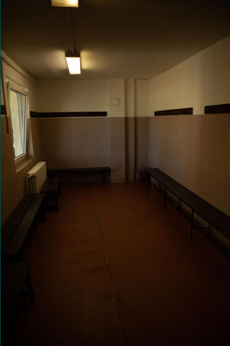
Nízká kapacita šaten