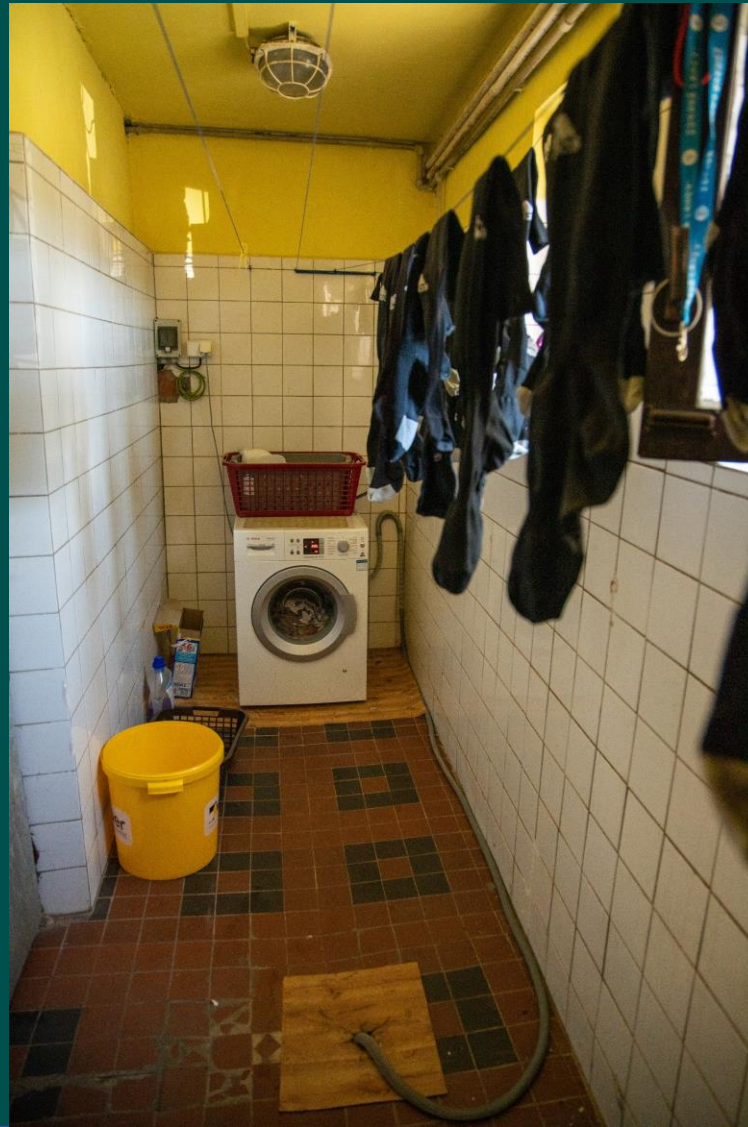
Nevyhovující stav prádelny