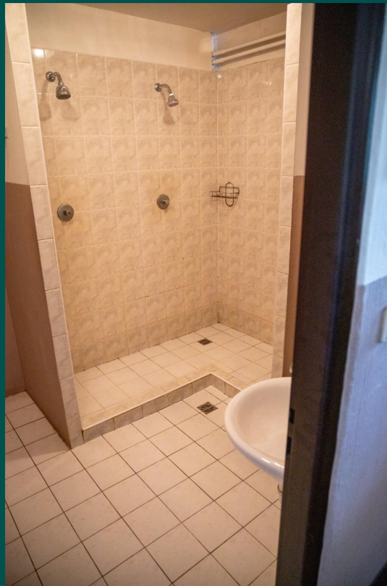
Nízká kapacita sprch