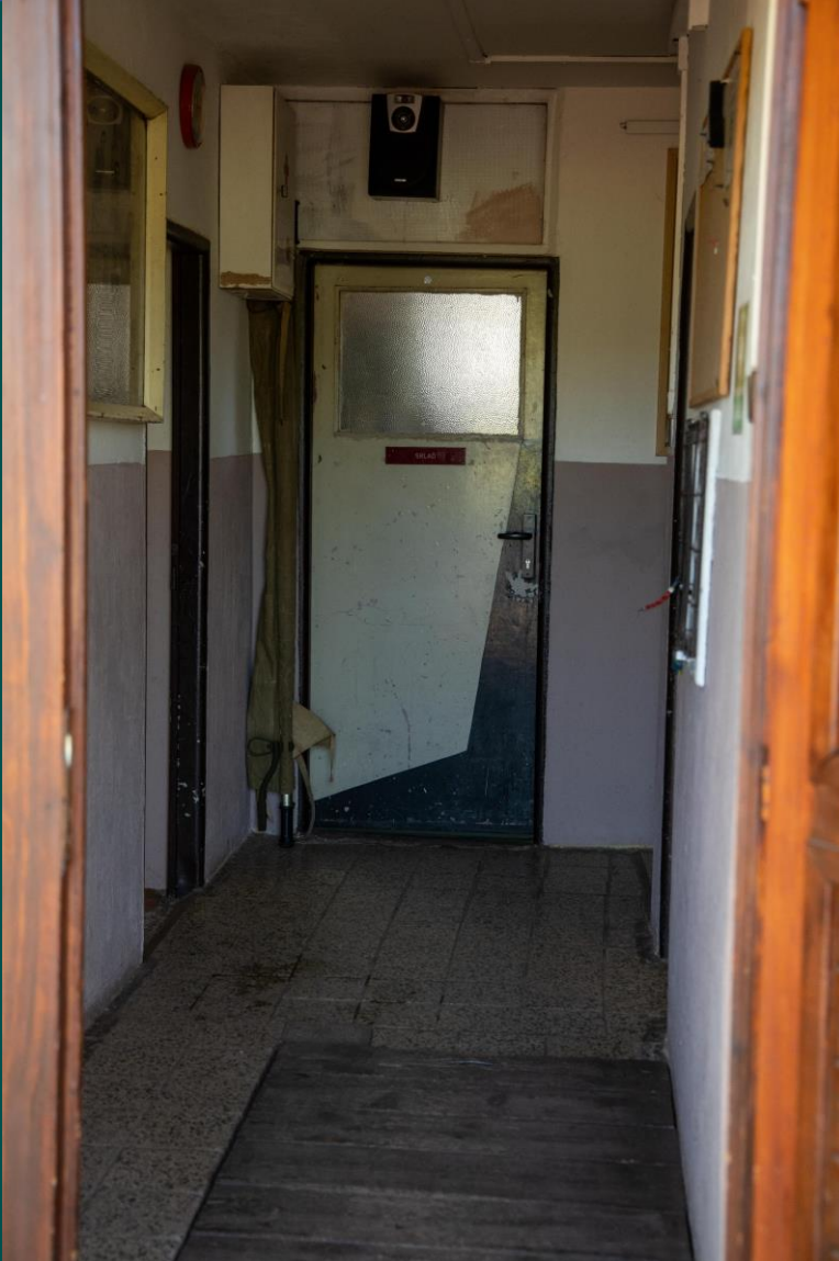
Špatný technický stav chodeb