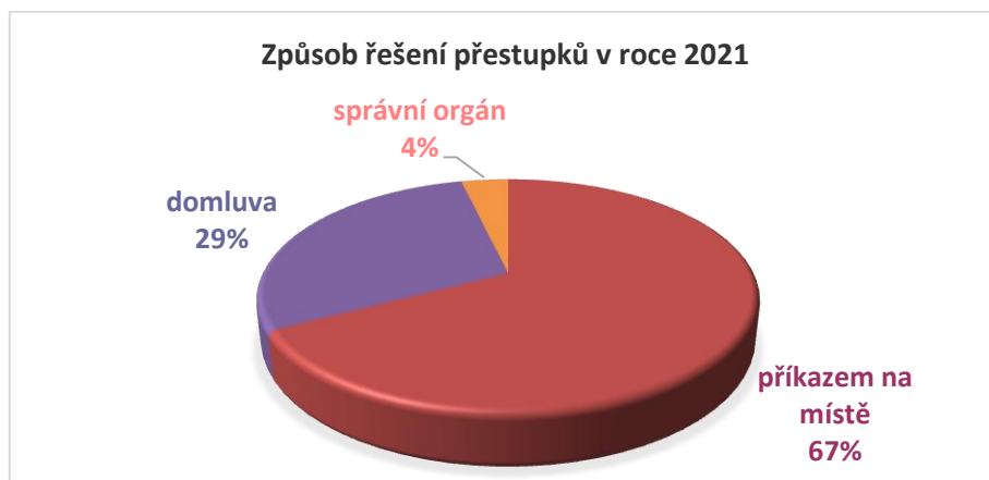
Graf č. 2 – Způsob řešení přestupků v roce 2021

V roce 2021 byly dále řešeny především přestupky v souvislosti s pandemií COVID-19. Celkem bylo řešeno více než 600 přestupků.