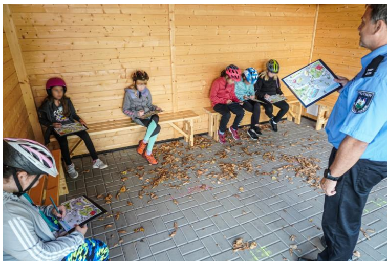
Obr. 2 – Ukázka preventivních aktivit

V rámci prevence taktéž úzce spolupracujeme s odbory městského úřadu a dalšími neziskovými organizacemi (Most k životu Trutnov, RIAPS) na konkrétních programech a událostech a při rozvoji sociálních služeb i při tvorbě a realizaci komunitního plánování, příkladně v odborné skupině pro osoby ohrožené sociálním vyloučením.