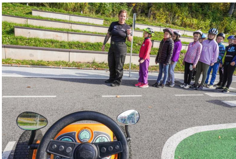
Obr. 1 – Ukázka preventivních aktivit

Prevence kriminality obsahuje soubor nerepresivních opatření, tedy veškeré aktivity vyvíjené různými subjekty směřující k předcházení páchaní kriminality a snižování obav z ní. Patří sem postup, jehož cílem či důsledkem je zmenšování rozsahu a závažnosti kriminality a jejích následků, ať již prostřednictvím restrikce kriminogenních příležitostí, nebo působením na eventuální pachatele a oběti trestných činů. Jedná se o opatření sociální prevence, situační prevence, včetně informování veřejnosti o eventualitách ochrany před trestnou činností a pomoci obětem trestných činů. V rámci prevence ochrany majetku městská policie dále pokračuje v projektu forenzního identifikačního značení jízdních kol a kompenzačních pomůcek.