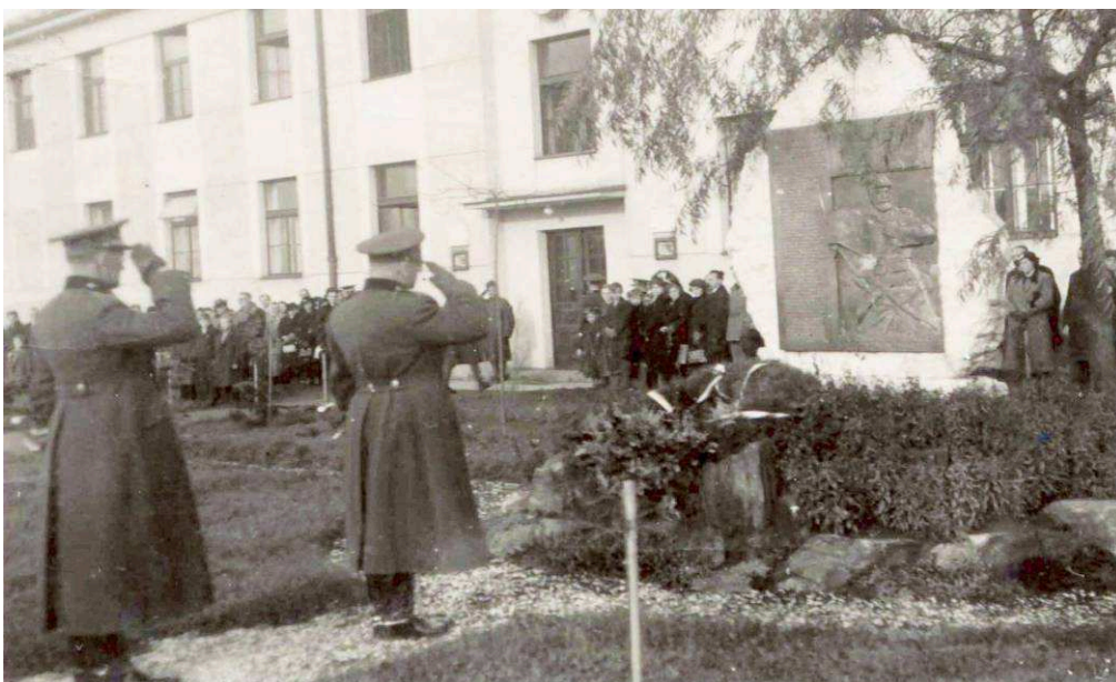
Památník Roty Nazdar – Trutnov

-Shodou okolností se tak v roce 2020 podařilo pořídit kopii původní bronzové desky a zajistit původní horní balvan. PČR vyhradila pro instalaci pomníku pozemek, kde nechala na jaře 2022 opravit základy. Soklový spodní díl pomníku se nedochoval, zrovna tak časem zašla i původní sadová úprava jeho okolí.