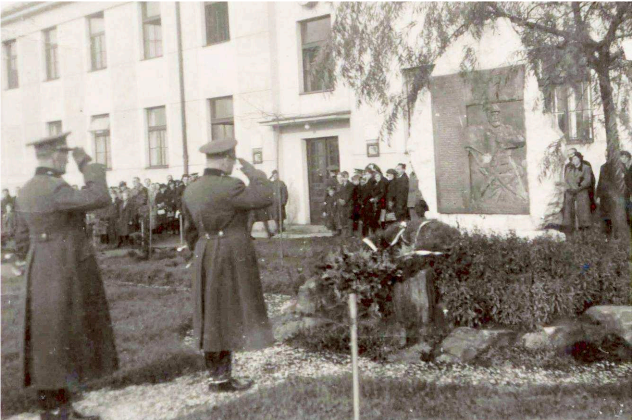
Památník Roty Nazdar - Trutnov

Shodou okolností se tak v roce 2020 podařilo pořídit kopii původní bronzové desky a zajistit původní horní balvan. PČR vyhradila pro instalaci pomníku pozemek, kde nechala na jaře 2022 opravit základy. Soklový spodní díl pomníku se nedochoval, zrovna tak časem zašla i původní sadová úprava jeho okolí.