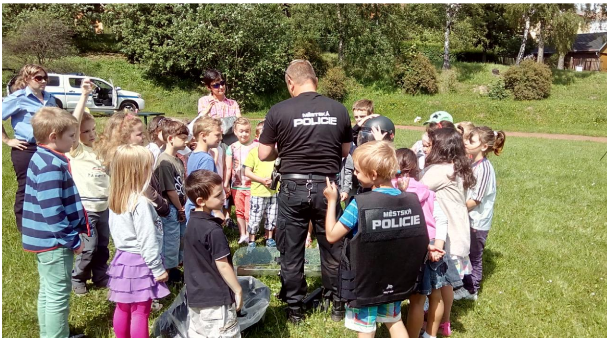
Obrázek č. 1 – Ukázka preventivní aktivity městské policie

Preventivní kooperativní činnost městské policie s Policíí České republiky je v rámci okresu Trutnov na velmi vysoké úrovni, což je při zajišťování místních záležitostí veřejného pořádku velmi významné. Za rok 2019 musím v neposlední řadě zmínit příkladně společné hlídky obou složek na vánočních trzích.