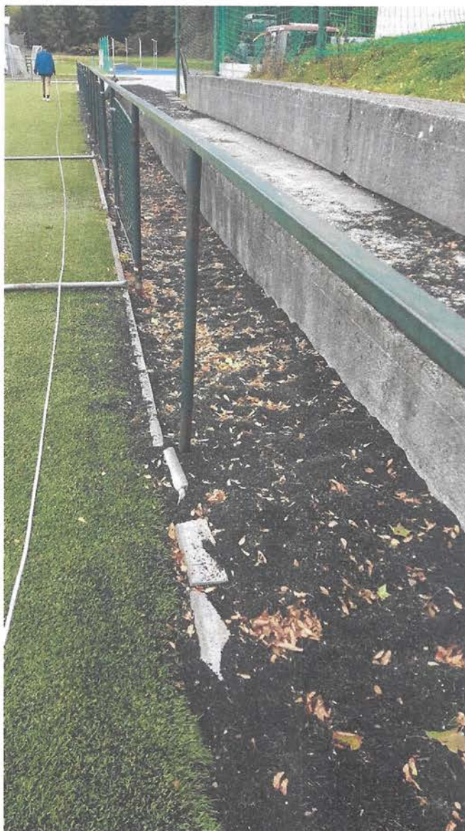
OBRÁZEK 5. SOUČASNÝ STAV – POŠKOZENÉ OBRUBNÍKY A ZÁBRADLÍ