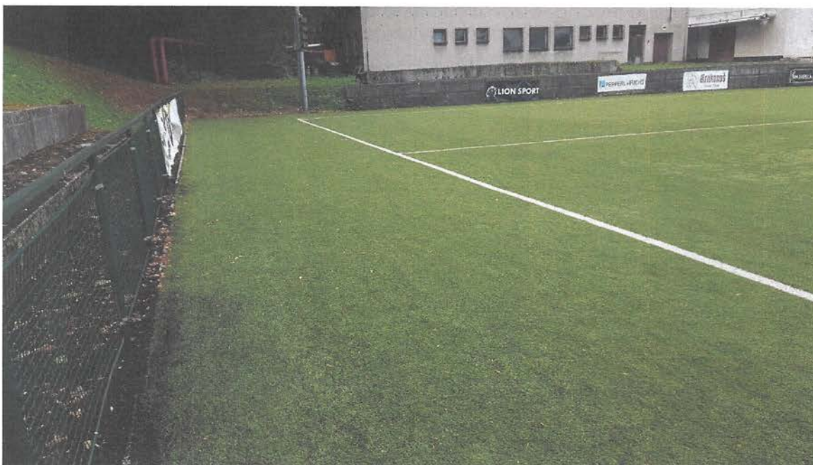
OBRÁZEK 1: SOUČASNÝ STAV