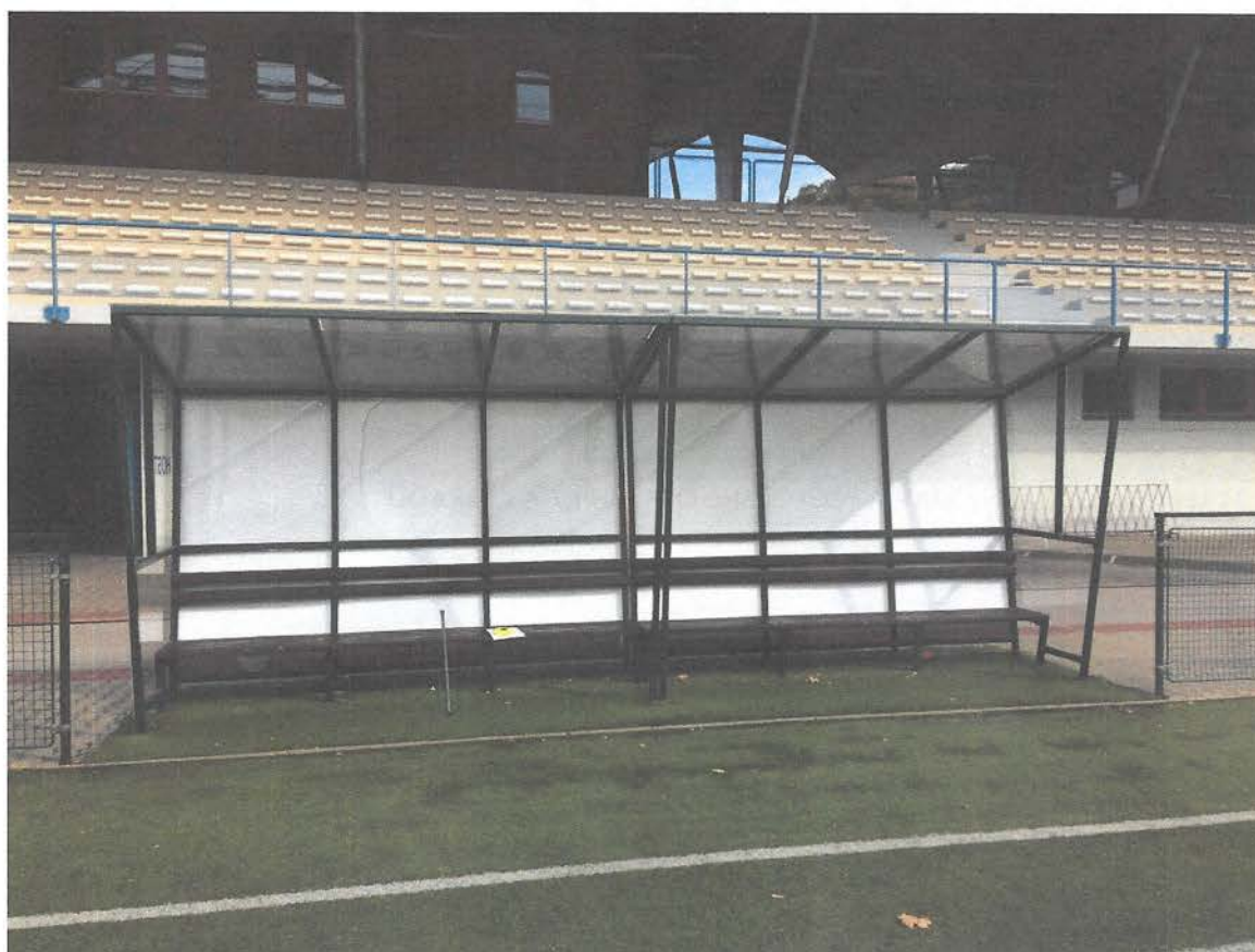
OBRÁZEK 4: SOUČASNÝ STAV – HRÁČSKÉ KABINY