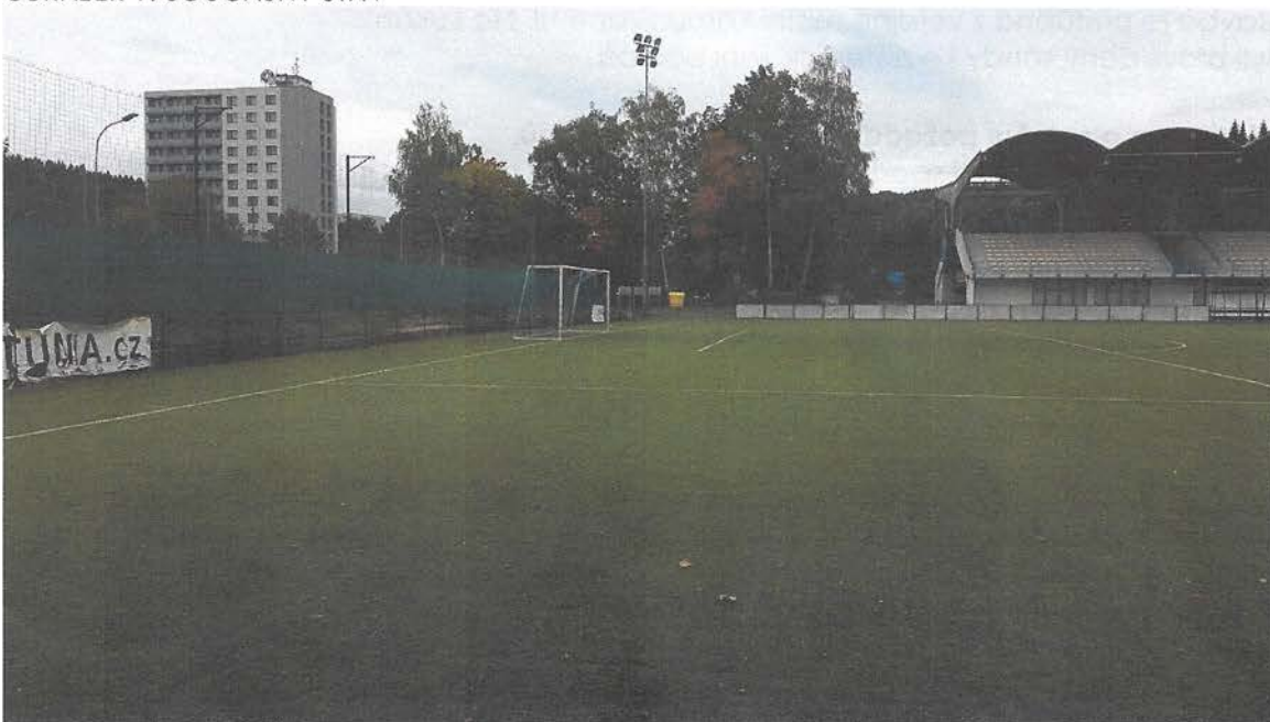
OBRÁZEK 2: SOUČASNÝ STAV