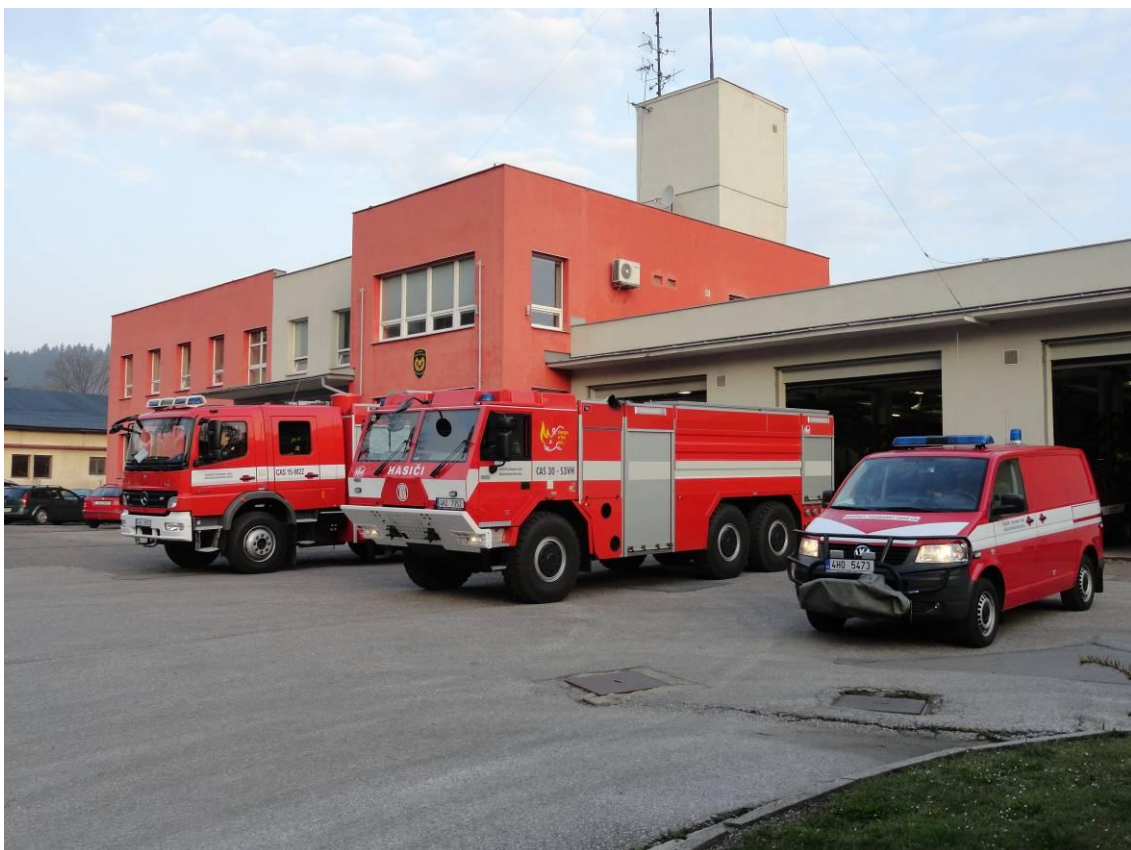
Požární stanice v Trutnově, Náchodská 475