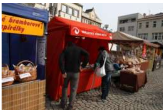
24. 9. 2016 Dvůr Králové nad Labem - Svatováclavské posvícení