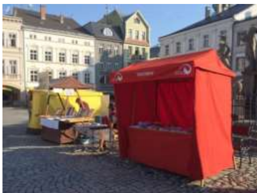
4. 9. 2016 Trutnovský jarmark

Dvůr Králové nad Labem • Hradec Králové Chrudim • Jaroměř • Mělník • Polička Nový Bydžov • Trutnov • Vysoké Mýto www.vennamesta.cz