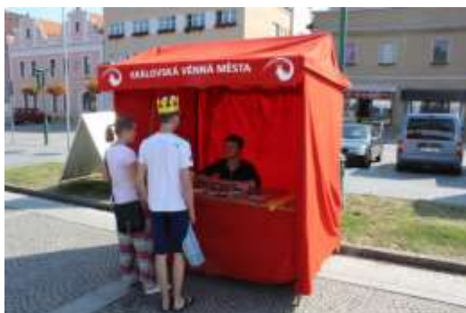
10. 9. 2016 Městské slavnosti Vysoké Mýto