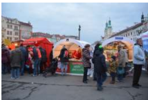
11. 11. 2016 Hradec Králové – Martin na bílém koni pod Bílou věží